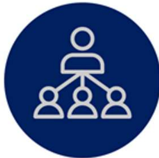
분반장 중심의 자치활동